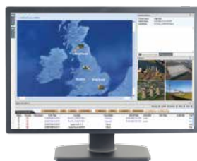
Sistema de Control