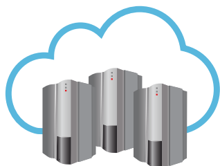
Servidor de RISCO Cloud

ProSYS™ Plus ha sido diseñada con el concepto de que una comunicación fiable es crucial para las instalaciones comerciales. No sólo permiten utilizar las últimas tecnologías disponibles de comunicación como múltiples conexiones IP, 3G, WiFi y RTC, sino que también es compatible con la configuración de múltiples vías para asegurar la correcta comunicación.